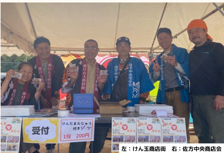
左：けん玉商店街 右：佐方中央商店会