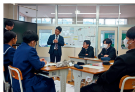
SAEKI DX(総合的な探究の時間)

12月6日(金)、吉和中学校にて、3年生を対象に模擬授業を行いました。まずは歴史総合の授業。佐伯高校の歴史は「歴史になにを学ぶのか」という視点で歴史の出来事に仮説を立て立証していく学びです。その後、吉和から通う現佐伯高校生に、飾らず素直な気持ちで現在の学校生活について話していただきました。最後に探究学習の一環であるSAEKI DXを体験してもらい、佐伯高校の魅力を知っていただく良い機会になったのではないかと思います。