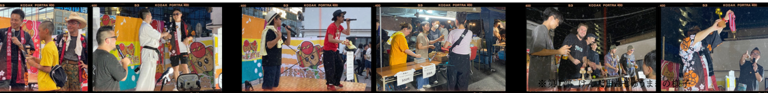
※けん玉ワールドカップの様子