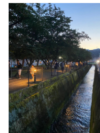
※ラグレスストリートの様子