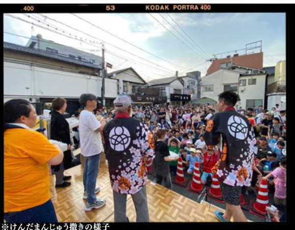
※けんだまんじゅう撒きの様子

このたびはお祭りへの多くの参加ありがとうございました。 以前も七夕まつりにはたくさんの方が来ていただきましたが今回は4年ぶりの開催でけん玉ワールドカップからの呼び込みもあり、いつも以上に盛り上がりだと思えます。反省点はありますが、第1回目多くの方が来てくださり大変嬉しく思います。 今後は「商店街といえば『けんだまつり』『だよね』と定着するよう、まずは10年続けられるお祭りしていきたいです。 また、子どもや地域の人の交流ができる空間を作りたいと考えています。今回のお祭りをきっかけに商店街をたくさん歩いて、好きになってほしいです。