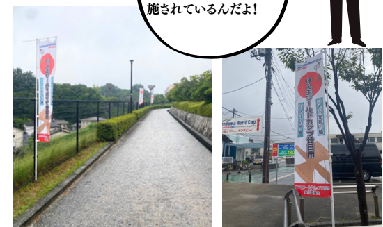
※グローバルリゾート総合スポーツセンターサンチェリーに上がる道