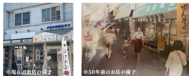
※現在のお店の様子

品を購入することは難しい…。そういう方もいらっしゃると思います。そんな方には「今の一番の目的は何か。」「何を一番治したいか。」「しっかり話を聞くようにしています。」「取材者：会話がすごく大切なんです。」 そうですね。お客さんが本望に望んでいることを提供するためには、会話はすごく大事だと思います。会話してうちに本望の悩みや別の悩みがつかく人もいらっしゃるんですよ。